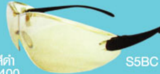
S5BC วัสดุน้ำเงิน เลนส์ใส