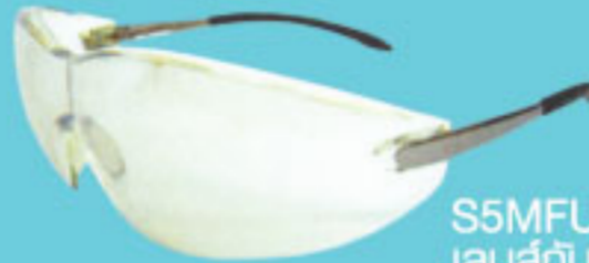
S5MFUV วัสดุน้ำเงิน เลนส์กัน UV 400