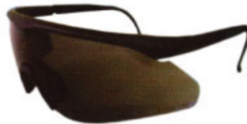
28140 กรอบสีดำ เลนส์เทา