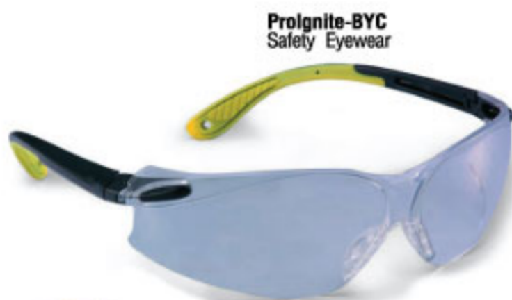
Proignite-BYC Safety Eyewear