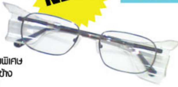
กรอบสี Dark Gun