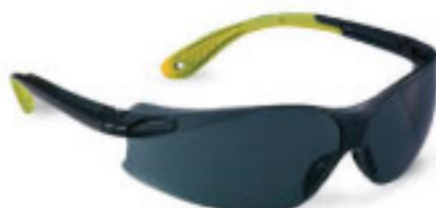
Proignite-BYS Safety Eyewear