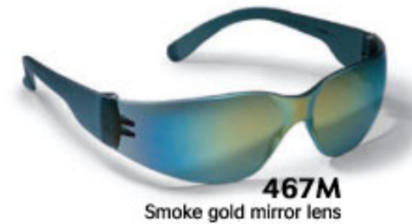
467M Smoke gold mirror lens