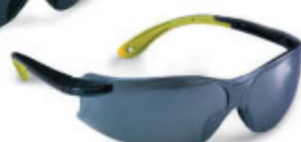
Proignite-BYCM Safety Eyewear