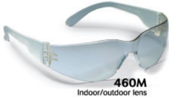
460M Indoor/outdoor lens