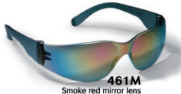
461M Smoke red mirror lens