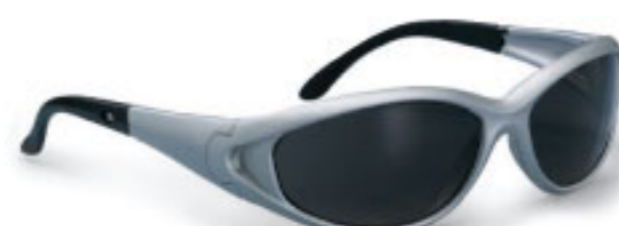
316S Iris Safety Eyewear