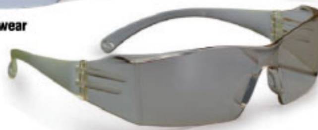
2422 Concept Safety Eyewear