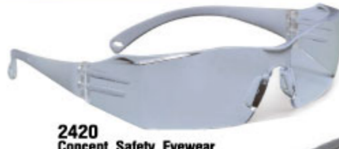
2420 Concept Safety Eyewear