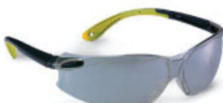
Proignite-BYIO Safety Eyewear