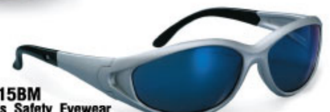
315BM Iris Safety Eyewear