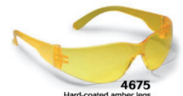
4675 Hard-coated amber lens