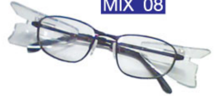
กรอบสี Dark Gun