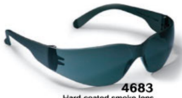
4683 Hard-coated smoke lens