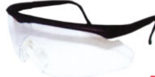
28160 กรอบสีดำ เลนส์ใส