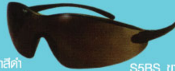
S5BS วัสดุน้ำเงิน เลนส์เทา