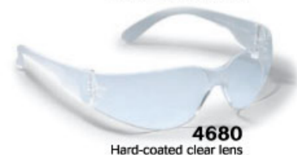
4680 Hard-coated clear lens