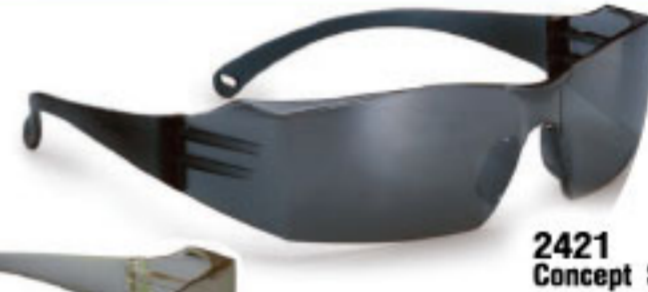
2421 Concept Safety Eyewear