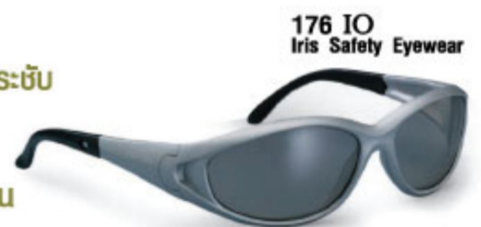
176 IO Iris Safety Eyewear