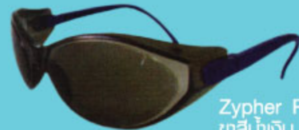
Zypher P BUS วัสดุน้ำเงิน เลนส์สีเทา