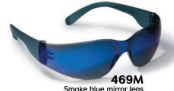
469M Smoke blue mirror lens