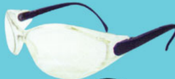
Zypher P BUC วัสดุน้ำเงิน

เลนส์โพลีคาร์บอเนต ป้องกันรอยขีดข่วน และแรงกระแทก