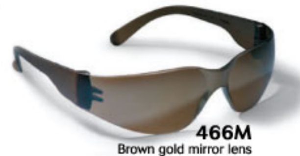
466M Brown gold mirror lens