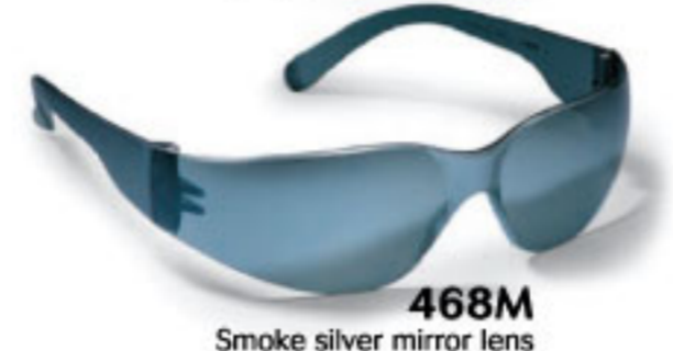
468M Smoke silver mirror lens