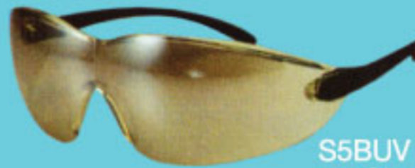
S5BUV วัสดุน้ำเงิน เลนส์กัน UV 400